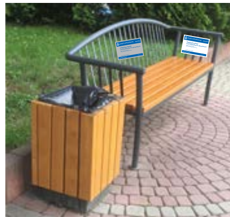
Przykładowe oznakowanie w ramach projektu