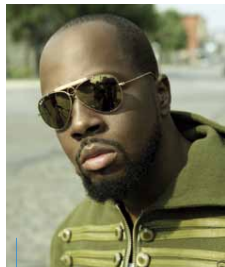
Gwiazdą tegorocznych Wianków w Krakowie będzie Wyclef Jean – jeden z założycieli i długoletni lider zespołu „Fugees”.

Talent producencki i muzyczny Wyclefa zaowocował wieloma udanymi projektami. Nagrywał m.in. z Bono, współpracował przy tworzeniu i wydawaniu „Supernatural” Carlosa Santany, pracował z Whitney Houston, a wykonany wraz z Shakirą utwór „Hips Don’t Lie” za-