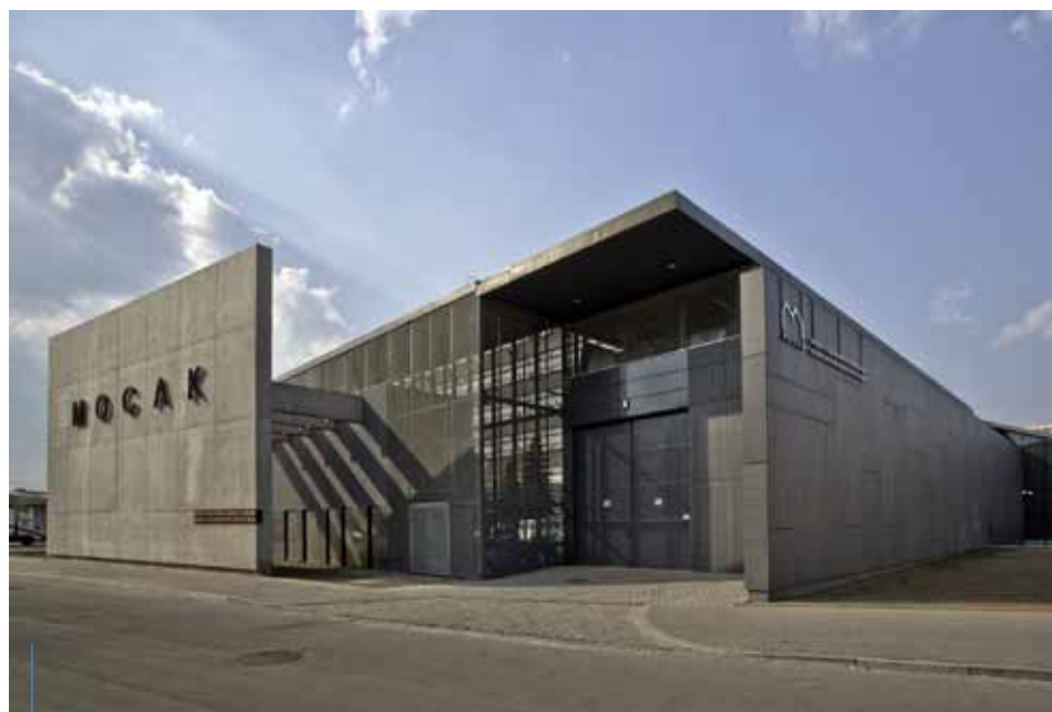
Całkowita powierzchnia użytkowa Muzeum Sztuki Współczesnej to blisko 10 tys. m kw.

Szczegółowe informacje o Muzeum Sztuki Współczesnej w Krakowie są dostępne na stronie: www.mocak.com.pl .