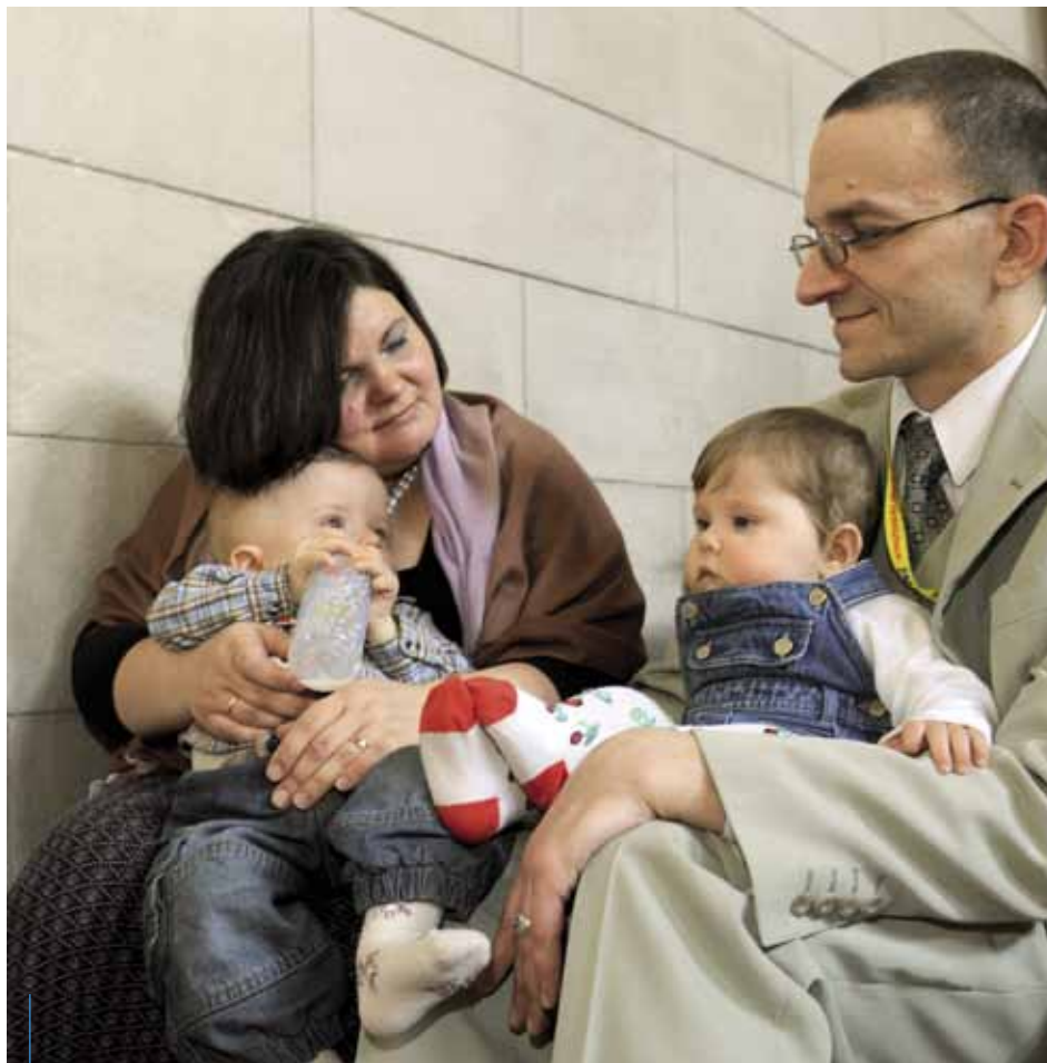
W Krakowie funkcjonuje 547 rodzin zastępczych, które stworzyły dom dla 685 dzieci.

Innym rodzajem rodziny zastępczej są rodziny niespokrewnione z dzieckiem. Te rodziny również ustanawia sąd. Rodziną zastępczą niespokrewnioną może zostać małżeństwo lub osoba samotna, pod warunkiem odbycia szkolenia w ośrodku adopcyjno-opiekuńczym. Trzeba również mieć odpowiednie warunki mieszkaniowe oraz stałe źródło utrzymania, dobry stan zdrowia (potrzebne jest tutaj zaświadczenie lekarskie). Rodzic zastępczy musi wywiązywać się z obowiązku łożenia na utrzymanie osoby najbliższej lub innej osoby, gdy ciąży na nim taki obowiązek z mocy prawa lub orzeczenia sądu. Nie może być także pozbawiony lub ograniczony w wykonywaniu władzy rodzicielskiej. Osoba, która chciałaby zostać rodzicem zastępczym, musi uzyskać pozytywną opinię ośrodka pomocy społecznej i dać rękojmię należytego wykonywania zadań rodziny zastępczej. Rodzicem zastępczym może być wyłącznie osoba mająca stałe miejsce zamieszkania na terytorium Rzeczypospolitej Polskiej i korzystająca z pełni praw cywilnych i obywatelskich. Poza tymi wymogami formalnymi, które nie są szczególnie obciążające, ważniejsze jest to, by umieć znaleźć miejsce w swoim życiu dla nowego dziecka. Niewielu z nas stać na ten niezwykły gest – zaledwie 52 rodziny w Krakowie przyjęły do swoich domów nie swoje dziecko, któremu jednak chcą dać wszystko to, co dałyby swojemu. Te rodziny również otrzymują pomoc finansową i korzystają ze wsparcia specjalistów.