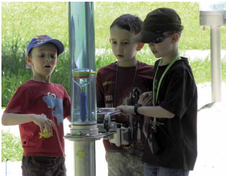
W Ogrodzie Doświadczeń im. S. Lema można zaprzyjaźnić się nawet z fizyką!

Wycieczki, warsztaty plastyczne, kulinarne, taneczne, plenery rysunkowe, szkółka gry na gitarze, joga dla malucha, gry i zabawy komputerowe, turniej w grach planszowych, miniatury teatralne i gorące lato w rytmie kubańskiej samby – to tylko kilka propozycji z bogatego wakacyjnego programu przygotowanego przez miejskie instytucje kultury. Tego lata nikt nie ma prawa się nudzić!