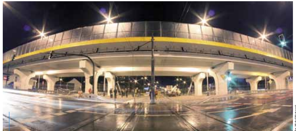
W najwyższym miejscu estakada wznosi się 6 metrów nad jezdnią.