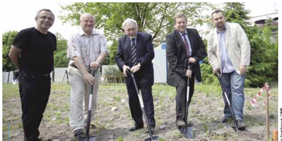
Z początkiem czerwca ruszyła odbudowa żłobka przy ul. Majora. Prace mają potrwać 6 miesięcy.

Odbudowa żłobka ma potrwać 6 miesięcy. Oddanie nowej placówki planowane jest na koniec 2011 roku.