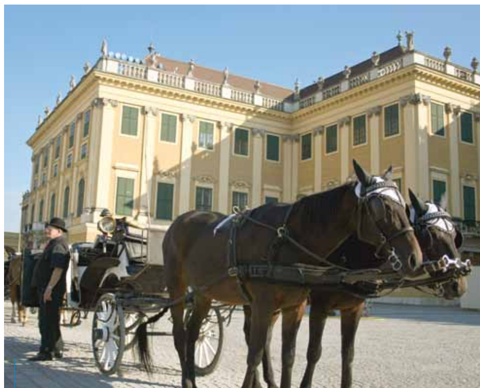
Pałac Schönbrunn w Wiedniu

W kontaktach Krakowa i Wiednia aktywną rolę odgrywa Biuro Miasta Wiednia, prowadzone przez firmę Compress i prężnie działające w Krakowie od 2002 r. Ważne jednak, że we współpracę krakowsko-wiedeńską zaangażowało się wiele instytucji i wielu mieszkańców obu miast.