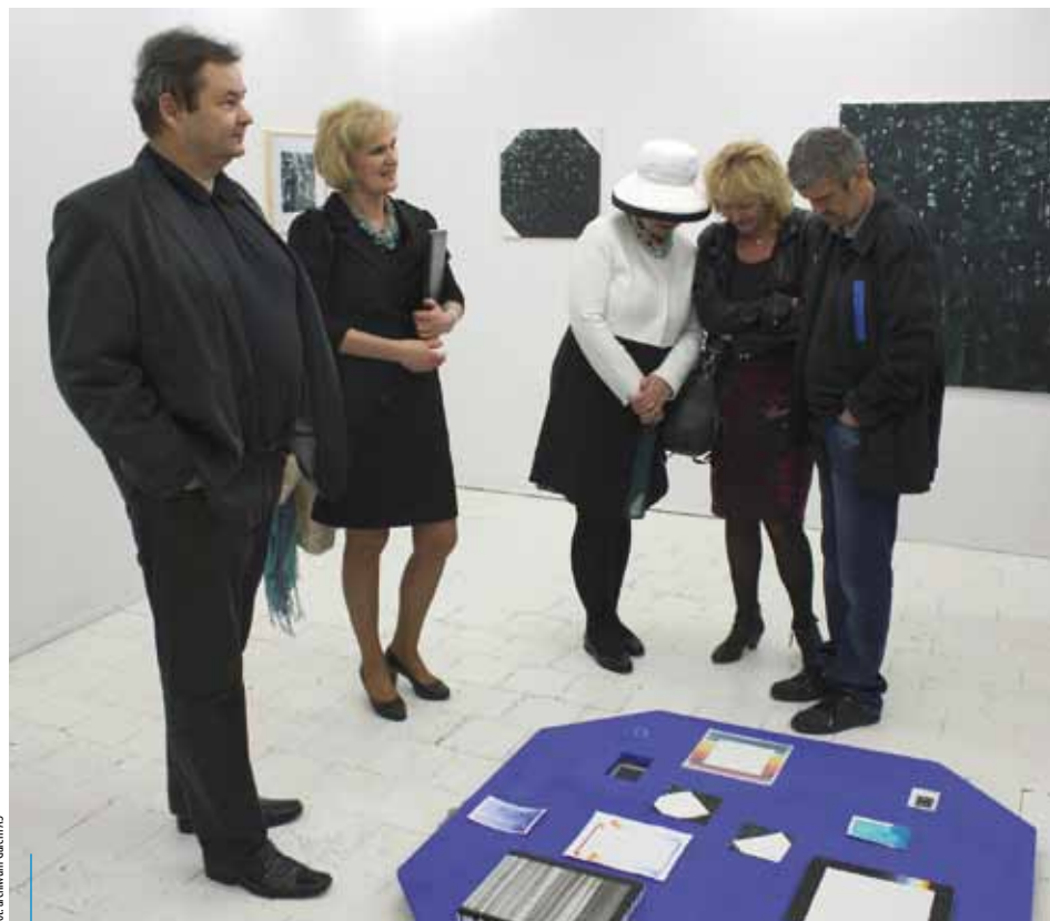
Otwarcie wystawy ADUMBRATION