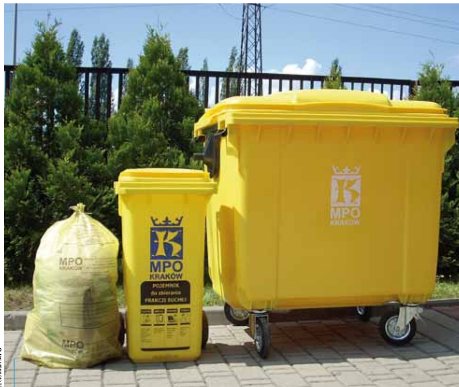
Do worków i pojemników w kolorze żółtym trafiają odpady posegregowane