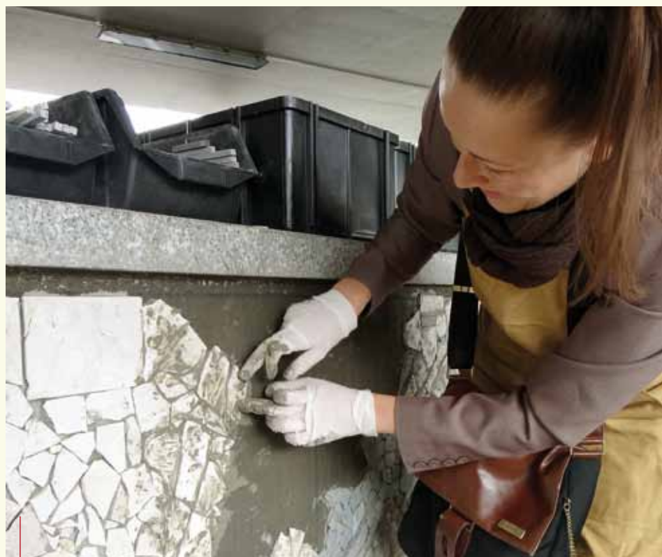
Kolejna część mozaiki na rondzie Mogilskim powstawała od 1 do 8 czerwca

Patronat medialny nad wydarzeniem objęli: Radio RMF MAXXX, „Dziennik Polski”, „Nowy Kamieniarz”, „Kurier Kamieniarski”, „Karnet”, dwutygodnik miejski KRAKÓW.PL, Magiczny Kraków, Krakow.travel, Stowarzyszenie Polskich Artystów Mozaiki oraz Kijów.Centrum.