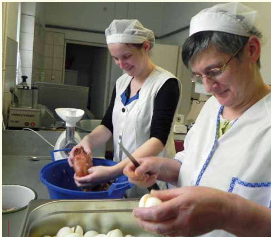
Pracownice Spółdzielni Socjalnej „Przystań”

Taka forma działalności daje realną możliwość wsparcia osób zagrożonych wykluczeniem społecznym w powrocie do uregulowanego życia społecznego i aktywności na rynku pracy.