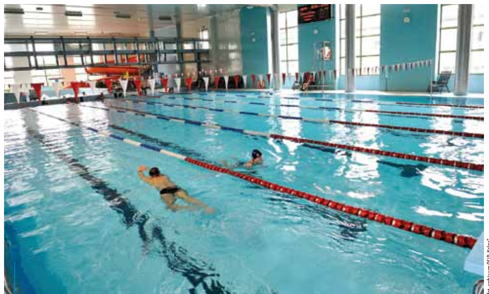
Rodzinne lekcje pływania odbędą się na basenie przy Kolnej

kowa ds. Rodziny i Polityki Społecznej, pomysłodawczyni i koordynatorka akcji. – Współ-